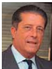
Federico Mayor Zaragoza